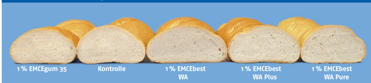
Abb. 2: Backversuche mit freigeschobenem Weißbrot

Die Porenbildung war gleichmäßig und die Elastizität der drei Tage alten Brote im Texture-Analyser vergleichbar.